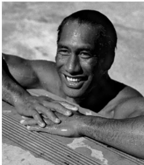
Duke Paoa Kahanamoku

Duke Paoa Kahanamoku fu un altro indiscusso protagonista di questi Giochi olimpici nel nuoto. Già vincitore di una medaglia d'oro e una d'argento