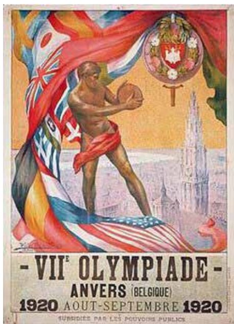
Il manifesto delle Olimpiadi estive del 1920

Il VII Giochi Olimpici si svolsero ad Anversa, in Belgio, nel 1920 nel periodo compreso tra il 14 agosto e il 12 settembre dopo che, dal 23 al 30 aprile, si erano tenuti i tornei di hockey e pattinaggio su ghiaccio. L'assegnazione fu dettata dalla necessità di orientarsi verso una delle nazioni più colpite dalla tragedia bellica per l'organizzazione di una manifestazione sportiva a livello internazionale.