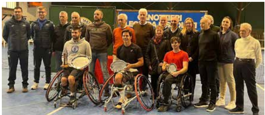
Autorità organizzatori e vincitori.