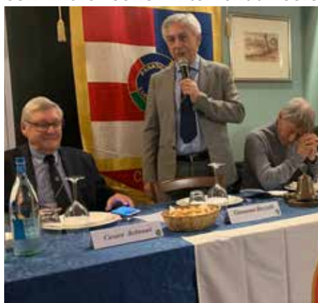
Il Presidente apre la conviviale.